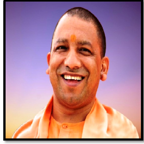
श्री योगी आदित्यनाथ जी माननीय मुख्यमन्त्री, उत्तर प्रदेश