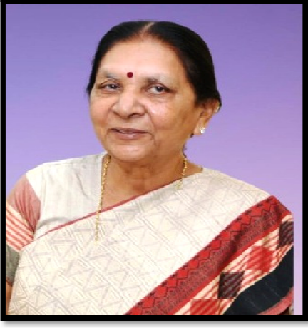
श्रीमती आंनदीबेन पटेल माननीया कुलाधिपति, उत्तर प्रदेश