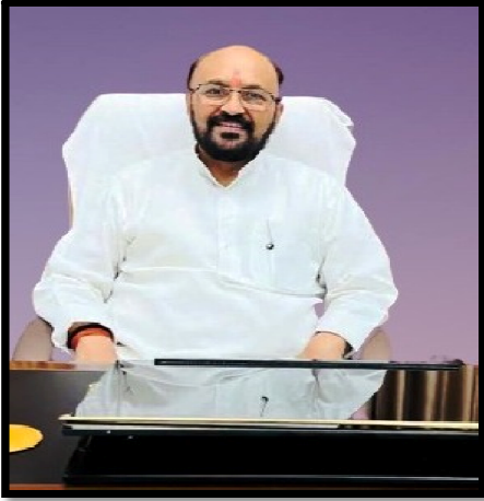
श्री योगेन्द्र उपाध्याय माननीय उच्च शिक्षा मंत्री उत्तर प्रदेश